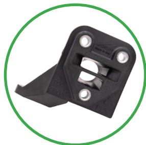
BRIDE THERMIQUE Avec 3 points de fixations.

Commande de l'accélérateur intégrée avec système d'arrêt, machine contrôlée pendant chaque phase de travail.