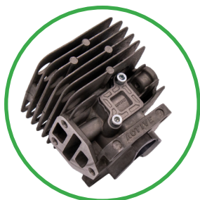
CYLINDRE En alliage d'aluminium avec la technologie STRATO CHARGED.

Commande de l'accélérateur intégrée avec système d'arrêt, machine contrôlée pendant chaque phase de travail.