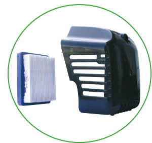
Filtre à air en papier

Poignée brevetée avec fonction antivibration et commande de retourneur de barre pour empêcher le crochet de sortir de la branche lors de la mise en marche