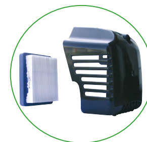
Filtre à air en papier

La tarière doit simplement tourner avec le moteur éteint dans le sens contraire des aiguilles d'une montre dans le but que la pointe se dévise du sol.